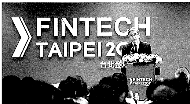
金融科技專業研討

以務實的探討與呈現導入科技後，金融服務的升級，展現台灣不同面向的金融科技應用具體成果。